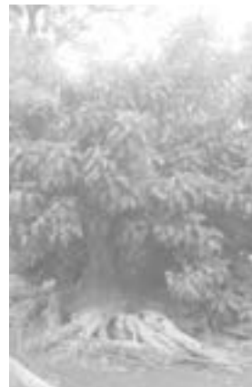
Phitolacca Piazza Lauro

mento di indirizzo meritevole di essere additato ad esempio ai giovanissimi studenti delle scuole sorrentine, e non solo, ai quali si potrà raccontare anche la suggestiva e tragica storia di questo giovane avvocato che tanto ha fatto per la salvaguardia del suo territorio e per la tutela dell'ambiente al punto di rimetterci anche la vita e che oggi può veder pubblicamente riscattato quel gesto che tanto dolore ha provocato nei cuori di chi l'ha amato.