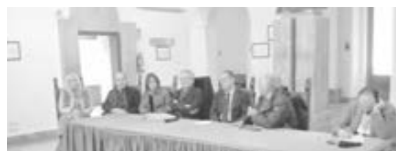
Assemblea Sindaci e Avvocati Sorrento

Lubrense e di Meta, su cui gravano i maggiori costi dovuti al personale trasferito presso l'ufficio del giudice di pace, se la vicenda ha avuto un esito positivo. Dopo la perdita della sezione del Tribunale di Sorrento, ormai trasferita a Torre Annunziata, mancava soltanto la chiusura dell'Ufficio del Giudice di Pace con altrettanto trasferimento a Torre per complicare in modo