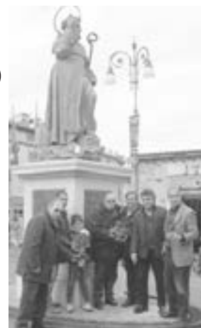
Omaggio al Santo Patrono